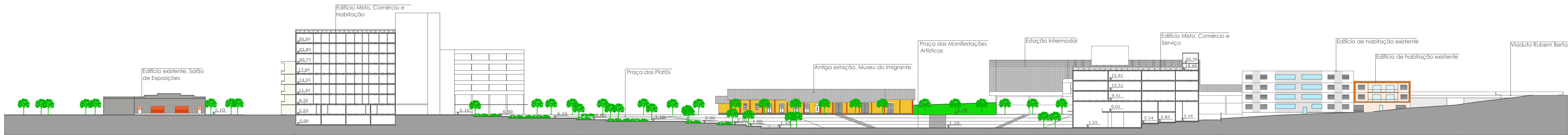
CORTE EE' ESC: 1/750